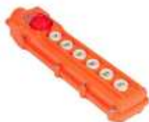
Controle Remoto com fio