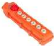
Mando a distancia con cable.