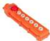
Mando a distancia con cable.

La minigrúa telescópica MGT 500 es ideal para montar en vehículos utilitarios comerciales pequeños, ya que está construida con acero Strenx ultrarresistente de 700 MP que también proporciona ligereza, flexibilidad y velocidad en el movimiento del equipo.