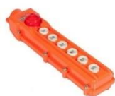
Controle Remoto com fio

O Mini Guindaste telescópico MGT 500 é ideal para montagem em veículos comerciais utilitários de pequeno porte por ser construído em aço de ultra resistência Strenx de 700 MP que conferem também Leveza, flexibilidade e rapidez na movimentação do equipamento.