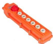
Controle Remoto com fio

O Mini Guindaste telescópico MGT 350 é ideal para montagem em veículos comerciais utilitários de pequeno porte por ser construído em aço de ultra resistência que conferem também Leveza, flexibilidade e rapidez na movimentação do equipamento.